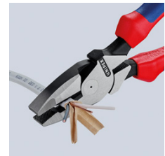
Lange Schneiden zum Trennen von flachen Kabeln

Technische Änderungen und Irrtümer vorbehalten