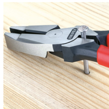
Greifzone unterhalb des Gelenks für kraftvolles Hebeln