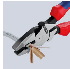
Lange Schneiden zum Trennen von flachen Kabeln