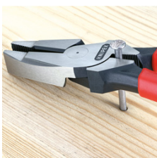
Greifzone unterhalb des Gelenks für kraftvolles Hebeln