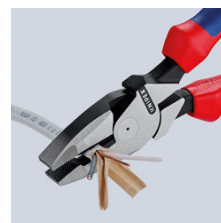
Lange Schneiden zum Trennen von flachen Kabeln

Technische Änderungen und Irrtümer vorbehalten