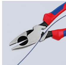
09 11/12 240: Kabel-Einziehhilfe im Gelenkspalt

Technische Änderungen und Irrtümer vorbehalten