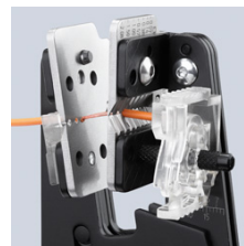
Formschlüssiges Abisolieren durch präzise Messerprofile

Technische Änderungen und Irrtümer vorbehalten