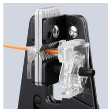
Sauberes Einschneiden der Isolation auf dem gesamten Umfang