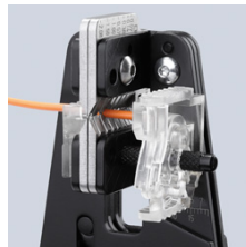
Sauberes Einschneiden der Isolation auf dem gesamten Umfang