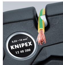
Drahtschneider bis 10 mm 2 mehrdrähtig