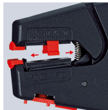
12 40 200; Einstellbarer Längenanschlag