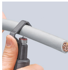
Ansetzen des Werkzeugs für Umfangsschnitt