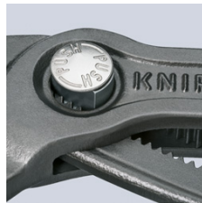
Feinverstellung per Druckknopf: schnell und komfortabel