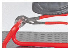
Gegen die Drehrichtung versetzte Zähne bewirken einen Selbstklemmeffekt und verhindern das Abrutschen am Werkstück.