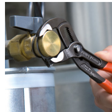
Schnelle und passgenaue Einstellung direkt am Werkstück