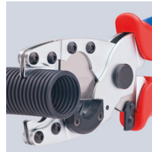
Sauberes Schneiden von Schutzrohren Ø 18 bis 35 mm

Technische Änderungen und Irrtümer vorbehalten