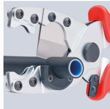
Verbundrohre Ø 12 bis 25 mm werden sauber und ohne Verformung geschnitten