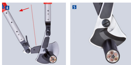
Nach dem ersten Teilschnitt die Schenkel per Ratschenprinzip öffnen