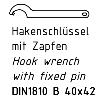
Hakenschlüssel mit Zapfen Hook wrench with fixed pin DIN1810 B 40x42

Copyright EWS Tool Technologies Weitergabe und Vervielfältigung dieser Unterlage, Verwertung und Mitteilung ihres Inhalts nicht gestattet, soweit nicht ausdrücklich zugestanden. Zuwiderhandlungen verpflichten zu Schadenersatz.