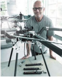
Die Wera Belts