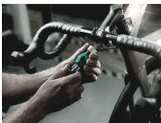
Stubby Ratschenschraubendreher mit Bit Magazin