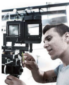
Mit Haltefunktion für Innen TORX® Schrauben