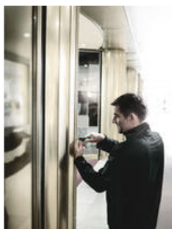
Bits mit reduziertem Schaftdurchmesser