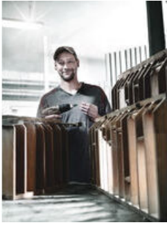
Bits mit reduziertem Schaftdurchmesser