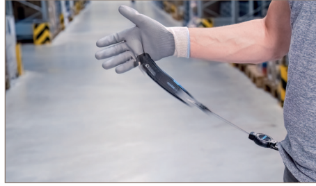
Messer im Moment des Loslassens.