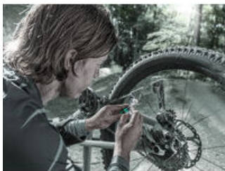
Das Bicycle Set 3 A

Mit den glasfaserverstärkten Reifenhebern aus Kunststoff lassen sich die Reifen sicher von der Felge hebeln, ohne die Felge zu beschädigen. Ein Reifenheber mit Ventilausdreher, ein Reifenheber mit 1/4" Bit-Aufnahme.