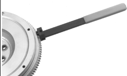
Anwendungsbeispiel: KL-0110 A