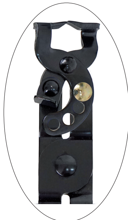
Zangenkopf 90° schwenkbar