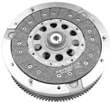
Abb. 1: Kupplungsscheibe aufsetzen.